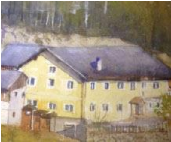
Gasthof Dorfmühle – Dorfstetten http://www.dorfmuehle.at/