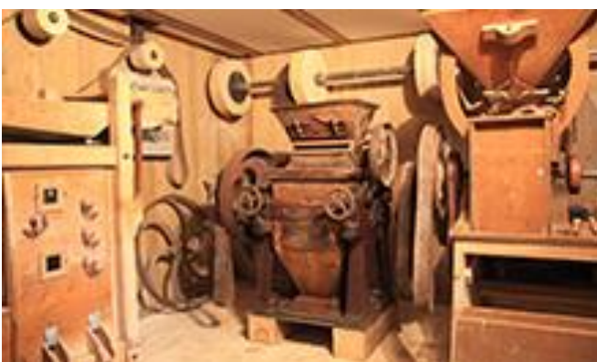
Schaubetrieb Mühle und Venezianersägewerk - http://www.dorfstetten.at/freizeitanlage/f-muehle.html