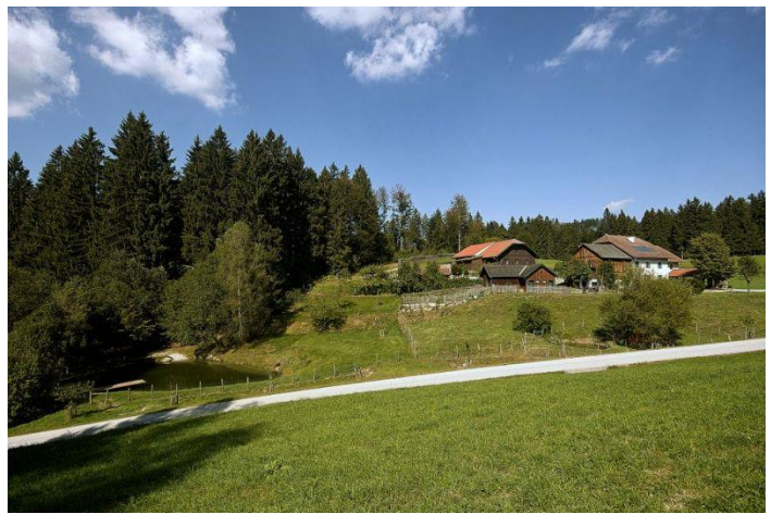
Imkerei Honighaus Frasl - Dorfstetten http://www.honighaus.at/